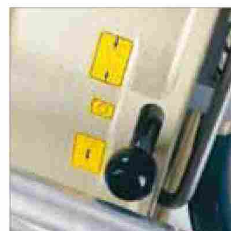
Простое и безопасное управление