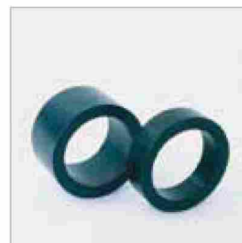
Дистанционные кольца (25мм и 50мм) для различных по толщине стен