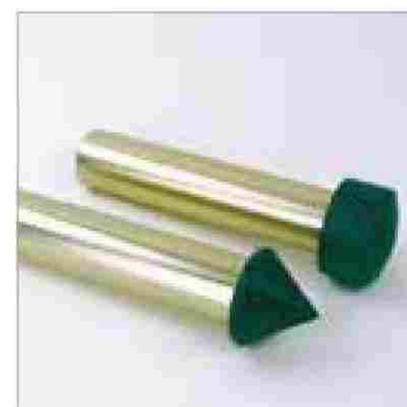
Различные насадки для определённых применений